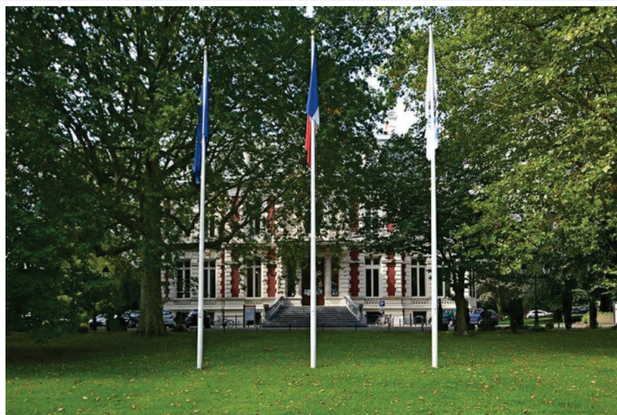
Hôtel de ville et son parc

AGO 2025 du CDMJSEA59 : Elle aura lieu le samedi 08 mars à 10h – Salle Gustave Dedecker